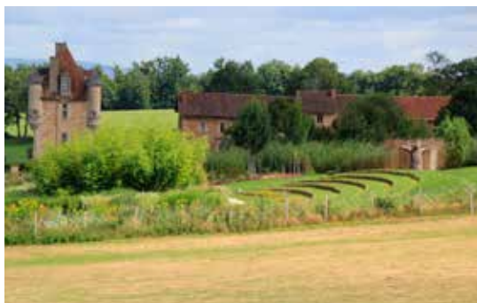
Het park met het openlucht theater

maaltijd temidden van de groenten die hier geteelt worden, een aperitief drinken tijdens een wandeling in de ecologische tuin, of een evenement organiseren in het door bamboe omsloten groene theater in de tuin. Voor de meer avontuurlijken onder U, bieden we een verkenning van het 12 hectare grote bos aan waar U de magie van deze plek kunt ontdekken.