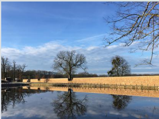
L'étang du domaine