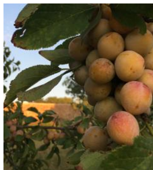
Vue de « Jardin en Mouvement »