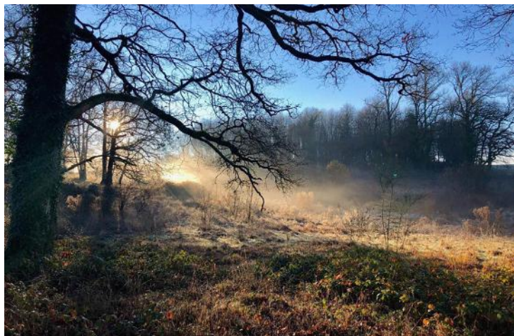
Les bois du domaine

Le domaine de La Borie est baigné de nature, mais il est facilement accessible grâce de sa proximité de Limoges avec la gare des Bénédictins et l'Aéroport International de Bellegarde.