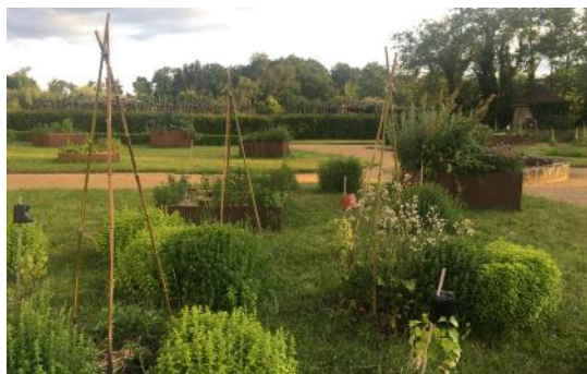
Le potager derrière le château