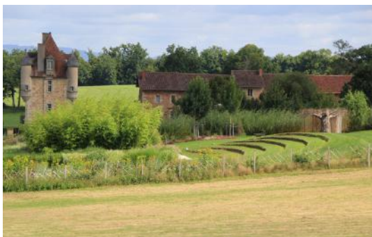
La théâtre de verdure

du « jardin à la française » derrière le château et le jardin de permaculture proposent chaque saison une variété de produits différents. Dans le « Jardin en Mouvement », vous rencontrerez toujours de nouvelles fleurs et buissons inattendus sur les petits sentiers. Pour les plus aventureux d'entre vous, nous vous proposons une exploration du terrain naturel de 12 hectares qui vous laisse découvrir la magie de cet endroit.